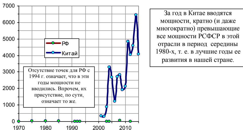
Рис. 1.140, б. Ввод мощностей по производству химических волокон и нитей, тыс. т.

Список литературы см. в книге или на сайте