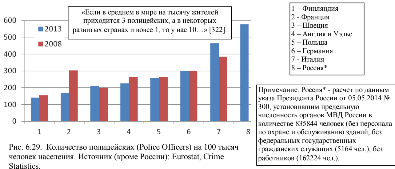
Рис. 6.29. Количество полицейских (Police Officers) на 100 тысяч человек населения. Источник (кроме России): Eurostat, Crime Statistics.

Примерные данные по некоторым странам приведены на рис. 6.29. Для России – без численности внутренних войск.