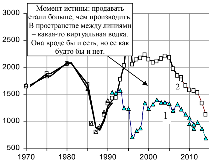
Рис. 3.90. Производство (1) продажа (2) водки и ликероводочных изделий в России, млн. литров в натуральном выражении. Источники: [I.6, I.7].

Водка прочно удерживает лидерство по продаже среди других алкогольных напитков в пересчете на спирт. Регистрируемые объемы производства и продажи водки и ликероводочных изделий представлены на рис. 3.90, объемы экспорта и импорта водки - на рис. 3.91.