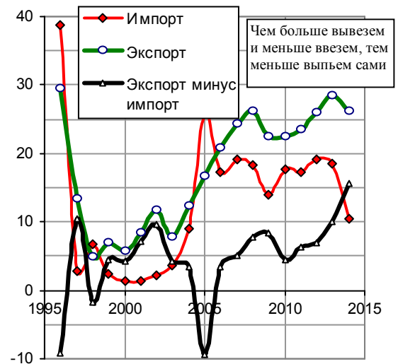
Рис. 3.91. Импорт, экспорт и разность между экспортом и импортом водки, млн. литров в пересчете на 100% спирт.

Ситуация после 1992 года похожа на скатерть-самобранку: продажа водки значительно превышает ее производство. Объясняется все довольно просто – в продаже велика доля нелегальной водки (рис. 3.92). И уменьшение производства водки после 1991 года (рис. 3.90) также объясняется резко возросшей продажей фальсификатов и суррогатов.