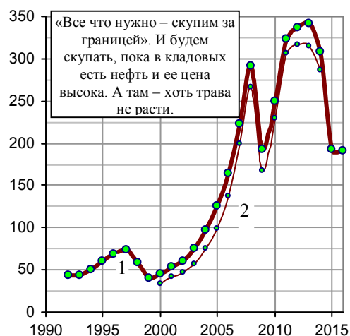
Рис. 1.584. Объем товарного импорта крупнейшими странами – импортерами и Россией, млрд. долл., текущие цены.

В.Путин, 11.07.2011: «Мы, слава Богу, или по несчастью, не печатаем резервной валюты, а они-то что творят? Хулиганят просто, станок включают и разбрасывают на весь мир, решая свои первоочередные задачи... США по полной программе используют монополию на печатание денег».