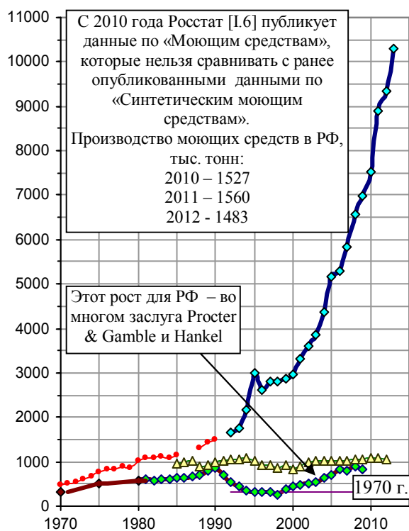
Рис. 1.143, а. Производство синтетических моющих средств в России, Китае, Японии и СССР, тыс. т. Источники: [I.3, I.6]; National Bureau of Statistics of China; Statistics Bureau, Japan.

В 2008 году объем производства синтетических моющих средств в России превысил показатель 1990 года (рис. 1.143, а). Но ситуация в подотрасли уже изменилась: если в советское время все предприятия были государственными, и большая часть прибыли от их деятельности поступала в российский бюджет, то теперь большая часть прибыли уходит за рубеж, а меньшая распределяется между российскими акционерами (рис. 1.143, б).