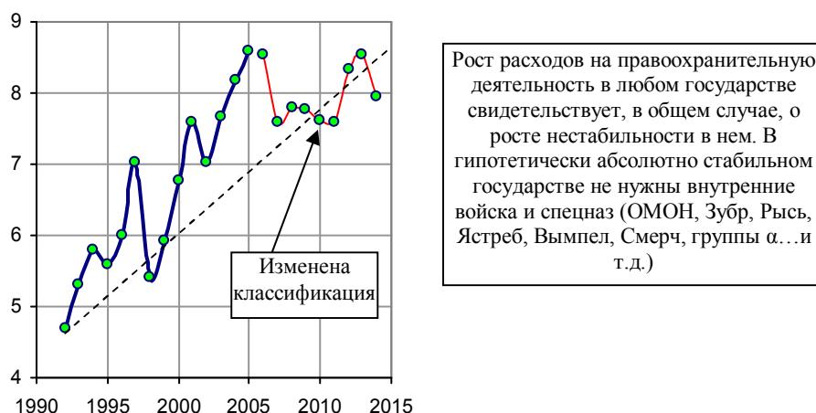
Рис. 1.480, а. Доля расходов на правоохранительную деятельность и обеспечение национальной безопасности государства в общей сумме расходов консолидированного бюджета РФ, %. Примечание: с 2005 года изменена бюджетная классификация.