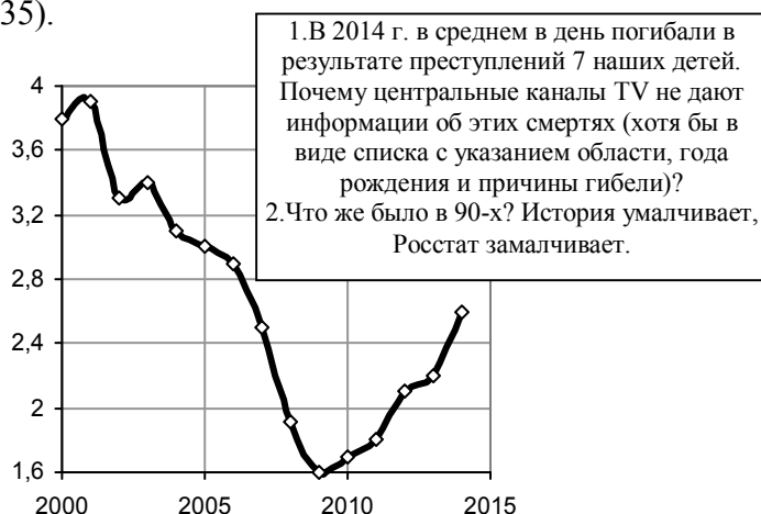
Рис. 2.135. Количество несовершеннолетних (до 17 лет включительно), погибших в результате преступлений, тысяч человек.

1. В 2014 г. в среднем в день гибли в результате преступлений 7 наших детей. Почему центральные каналы TV не дают информации об этих смертях (хотя бы в виде списка с указанием области, года рождения и причины гибели)? 2. Что же было в 90-х? История умалчивает, Росстат замалчивает.