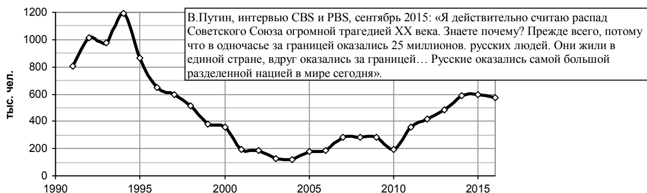
Рис. 2.13. Количество человек, прибывших в РФ (в основном из стран СНГ и Балтии).

Беженцы с «окраин» за бесценок отдавали свои квартиры, имущество и, вопреки препятствиям, создаваемым чиновниками, возвращались в Россию. Оседали, в основном, в небольших городах, поселках, деревнях, в которых недорогое жилье. Работы в небольших городах нет, в деревнях зарплата мизерная и «мигранты» были поставлены на грань выживания, еще более острую, чем коренные жители глубинки. Но именно они несколько улучшили демографическую ситуацию в России. Именно приездом на родину миллионов русских, бежавших из стран СНГ, частично компенсировались потери населения. Именно благодаря их приезду не так резко уменьшалась численность населения России в период реформ (рис. 2.13), не так заметны были провалы в демографической политике.