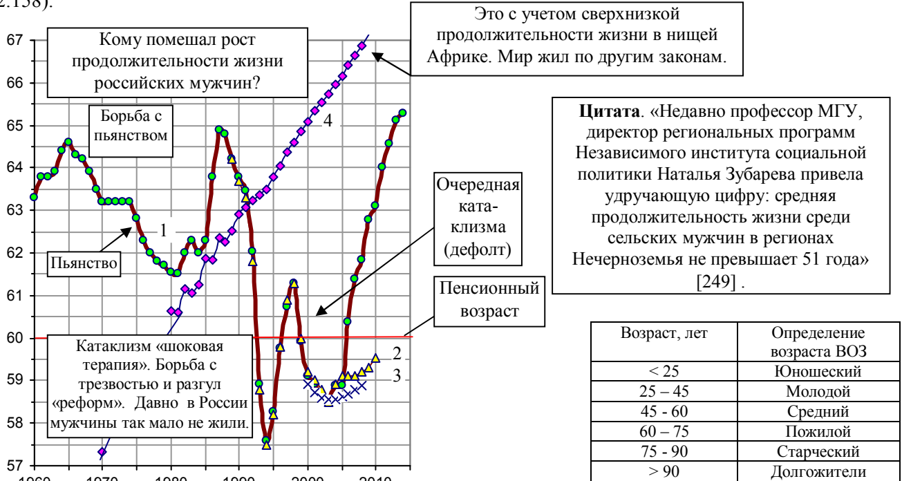
Рис. 2.158. Средняя ожидаемая продолжительность жизни мужчин при рождении в России по данным Росстата (линия 1), по данным U.S. Census Bureau, International Data Base (линия 2) и UN ESCAP (линия 3). Линия 4 – средняя ожидаемая продолжительность жизни мужчин при рождении в среднем в мире по данным WDI.

Очень недолго, неприлично мало для развитой страны, живут в России мужчины (рис. 2.158 - 2.160). По сравнению с 1965 годом в 1994 году продолжительность жизни мужчин в России сократилась на 7 лет. Многие годы, в среднем по стране, она была меньше пенсионного возраста (рис. 2.158).