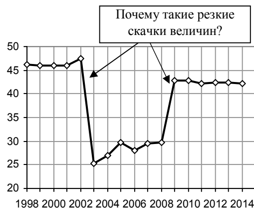
Рис. 3.9. Доля (%) больных туберкулезом органов дыхания, имевших запущенную его форму.

Список литературы и дополнительную информацию см. в книге или на сайте.