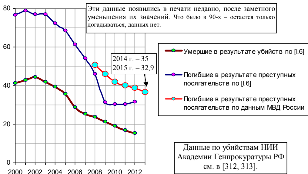
Рис. 6.13, б. Количество лиц (мужчин и женщин), погибших в результате преступных посягательств в России, тысяч.

Количество погибших от преступных посягательств существенно отличается от числа погибших (умерших) в результате убийств. Сравним данные МВД (справочная информация на сайте http://mvd.ru ) и данные Росстата [1.6].