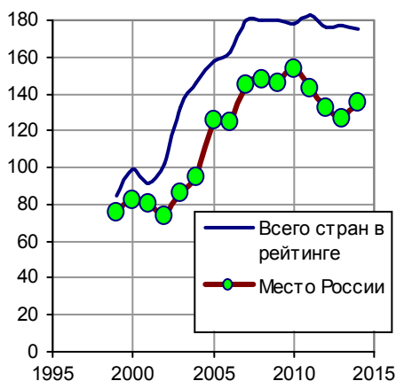
Место России в рейтингах Transparency International.

Международная организация Transparency International (ТИ), занимающаяся проблемами противодействия коррупции, публикует индекс восприятия коррупции. Он основывается на данных многочисленных опросов предпринимателей и экспертов, касающихся их оценок уровня коррупции в государственных секторах более чем 160 стран мира. Индекс имеет значение от 0 до 10 баллов: чем больше индекс, тем ниже коррупция в стране.