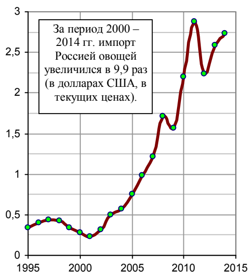
Рис. 1.382, а. Импорт Россией овощей, млрд. долл.

Основные импортные товары России (по весу): помидоры, лук и чеснок, капуста, морковь и репа, огурцы. Т.е. товары, которые можно успешно выращивать в стране. Основные экспортеры овощей в Россию (на 2014 г.): Турция, Китай, Израиль, Египет, Беларусь.