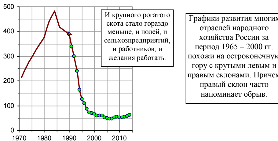
Рис. 1.316. Внесение органических удобрений под посевы в сельхозпредприятиях России, млн. т. Источники: [I.6, I.7].