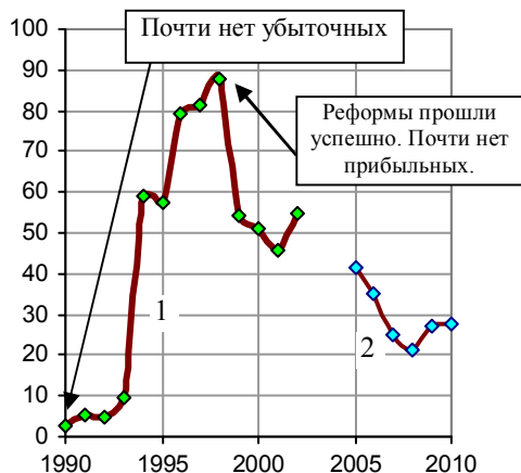
Рис. 1.300, а. Доля убыточных предприятий в сельском хозяйстве (линия 1, в процентах от общего числа сельхозпредприятий, данные приведены для крупных и средних предприятий).

Реформы привели и к росту количества убыточных хозяйств (до 90% от общего их числа в 1998 г., рис. 1.300). Было ли это неожиданным для реформаторов, или так и планировалось?