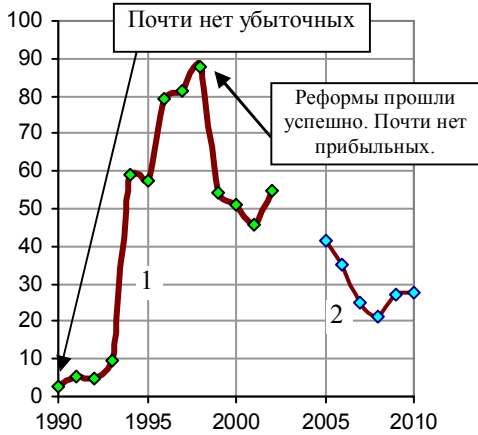
Рис. 1.300, а. Доля убыточных предприятий в сельском хозяйстве (линия 1, в процентах от общего числа сельхозпредприятий, данные приведены для крупных и средних предприятий).

Реформы привели и к росту количества убыточных хозяйств (до 90% от общего их числа в 1998 г., рис. 1.300). Было ли это неожиданным для реформаторов, или так и планировалось?