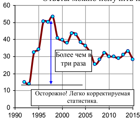
Рис. 1.53, а. Удельный вес убыточных организаций в экономике России в процентах от общего числа организаций. Источник: [I.6, I.7, I.18].

Ответы можно получить при анализе приведенных ниже данных.