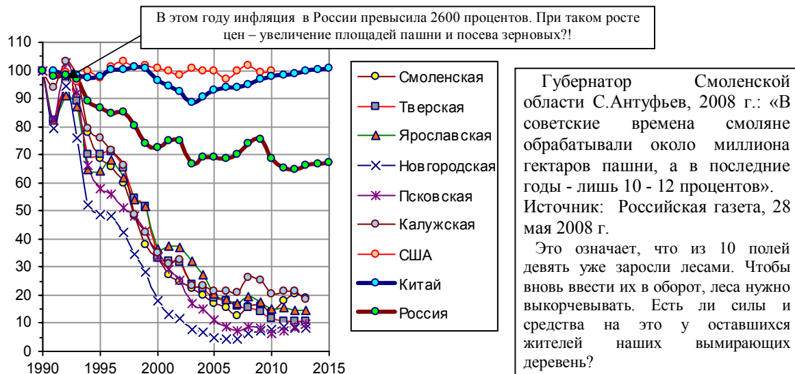
Рис. 1.319. Изменение посевных площадей зерновых культур в хозяйствах всех категорий России и некоторых центральных ее областей по сравнению с 1990 годом, 1990 г. – 100. Для сравнения приведены данные по изменению площадей под зерновыми в США и в Китае.

В некоторых центральных и северных областях все посевные площади уменьшились в 2 - 3 раза, а посевные площади зерновых – многократно (рис. 1.319).