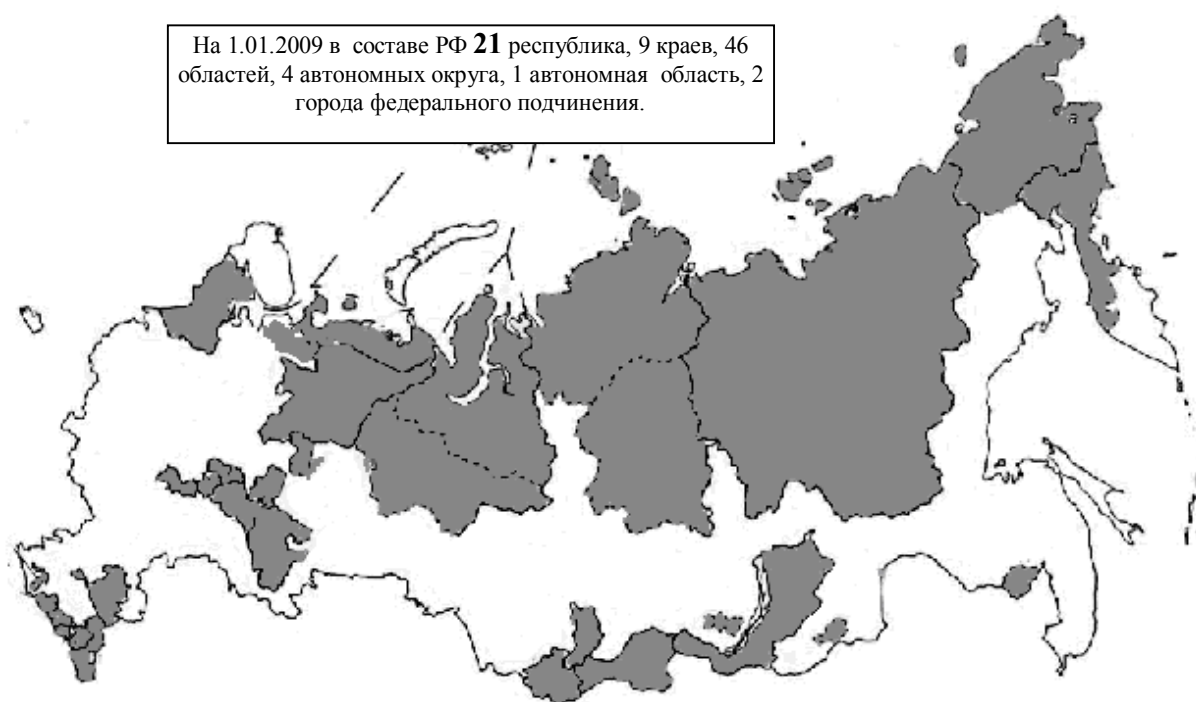
Рис. 8.1. Контурная карта Российской Федерации. Темным цветом показаны республики и автономные округа, входящие в состав Российской Федерации (по состоянию на 2000 год).

Печатаются карты, показывающие национальные автономные республики, области, округа и уязвимость национального устройства страны (рис. 8.1). Аналогичные карты без труда можно найти в Интернете, отечественной литературе, например в [225].