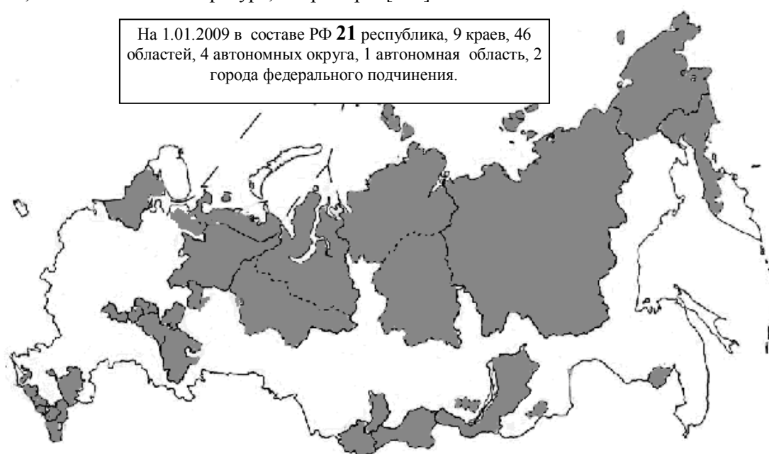
Рис. 8.1. Контурная карта Российской Федерации. Темным цветом показаны республики и автономные округа, входящие в состав Российской Федерации (по состоянию на 2000 год).

Печатаются карты, показывающие национальные автономные республики, области, округа и уязвимость национального устройства страны (рис. 8.1). Аналогичные карты без труда можно найти в Интернете, отечественной литературе, например в [225].