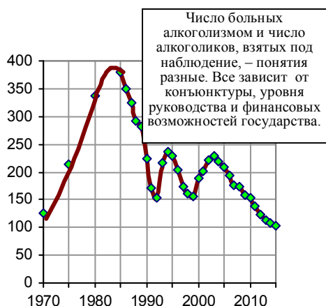
Рис. 3.100. Число больных, взятых под наблюдение с впервые в жизни установленным диагнозом «алкоголизм и алкогольные психозы» в России, тыс. чел. Источник: Росстат [1.6].

Кто считает больных алкоголизмом, например, в наших деревнях, селах и отдаленных поселках, в которые и скорая помощь добирается с трудом? Да и какой смысл их регистрировать? Других больных много. Если бы зарплата работников ЛПУ напрямую и хорошо зависела от числа зарегистрированных алкоголиков, то число последних в государстве значительно (кратно) увеличилось.