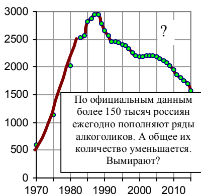
Рис. 3.101. Численность больных, состоящих на учете в лечебно-профилактических учреждениях с диагнозом «алкоголизм и алкогольные психозы» в России, тыс. чел. Источник: Росстат [1.6].