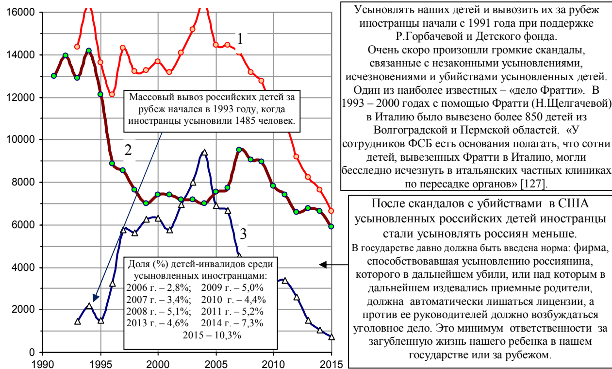
Рис. 2.119. Количество ежегодно усыновляемых российских детей (1), в том числе усыновленных российскими (2) и иностранными (3) гражданами. При построении графика использованы данные [1.6], Национального статистического комитета Республики Беларусь, материалы Минобрнауки РФ и интернет-проекта Минобрнауки РФ «Усыновление в России», www.usynovite.ru .

За 22 года (1993 – 2014 гг.) за рубеж вывезено более 100 тысяч ненужных государству российских детей. Для сравнения: за 4 года, с 2005 г. по 2008 г., из Республики Беларусь иностранцы вывезли четырех усыновленных белорусских детей.